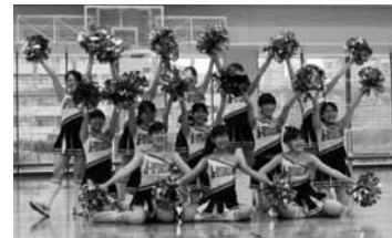
チアダンスサークル・A-Winds (アーウィズ) <県立保健福祉大>

小さな子どもから高齢の方々まで、住民の皆様が福祉を身近に感じ、ふれあっていただけるまつりを目指しています。