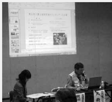
被災地に何度も足を運んだ丸さんの話は説得力がありました。